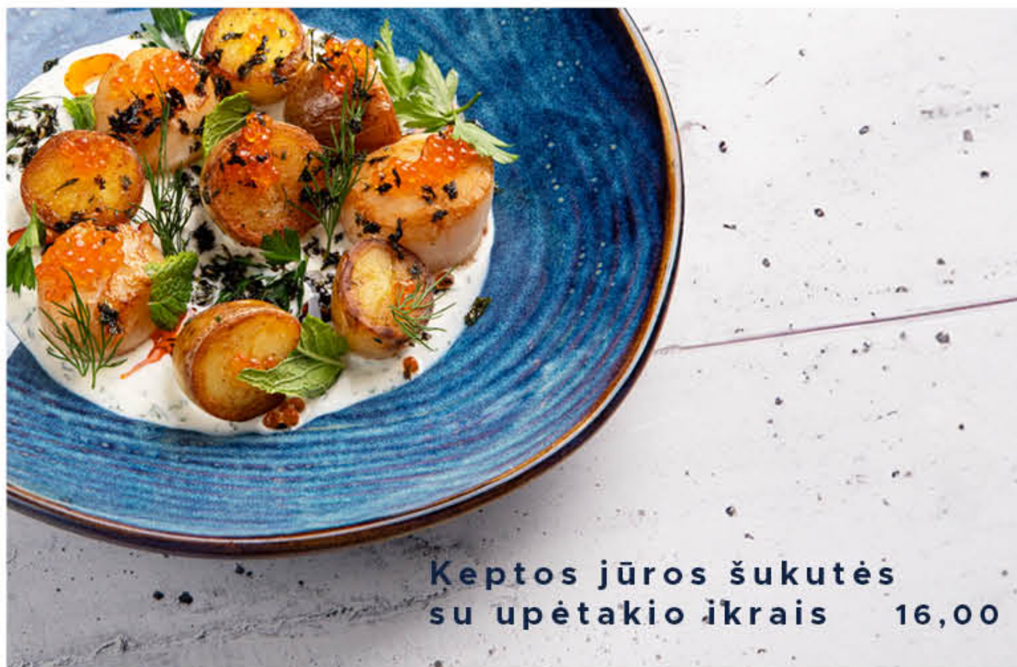
Keptos jūros šukutės su upėtakio ikrais 16,00