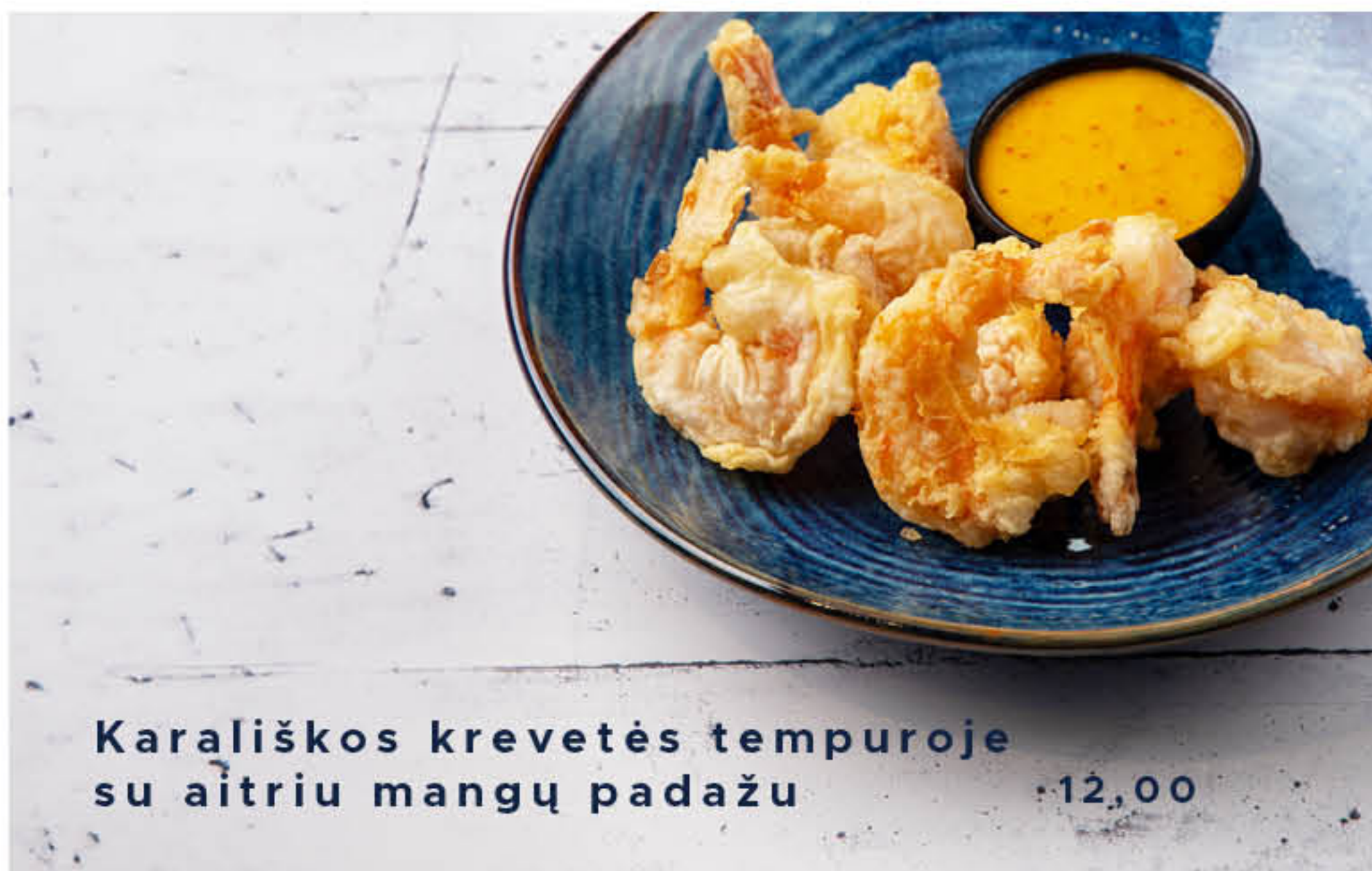
Karališkos krevetės tempuroje su aitriu mangų padažu 12,00