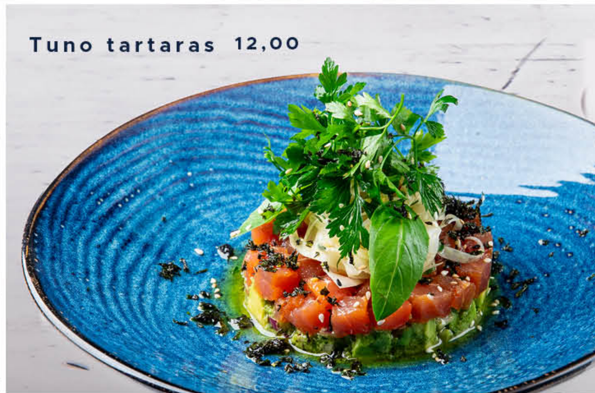
Tuno tartaras 12,00