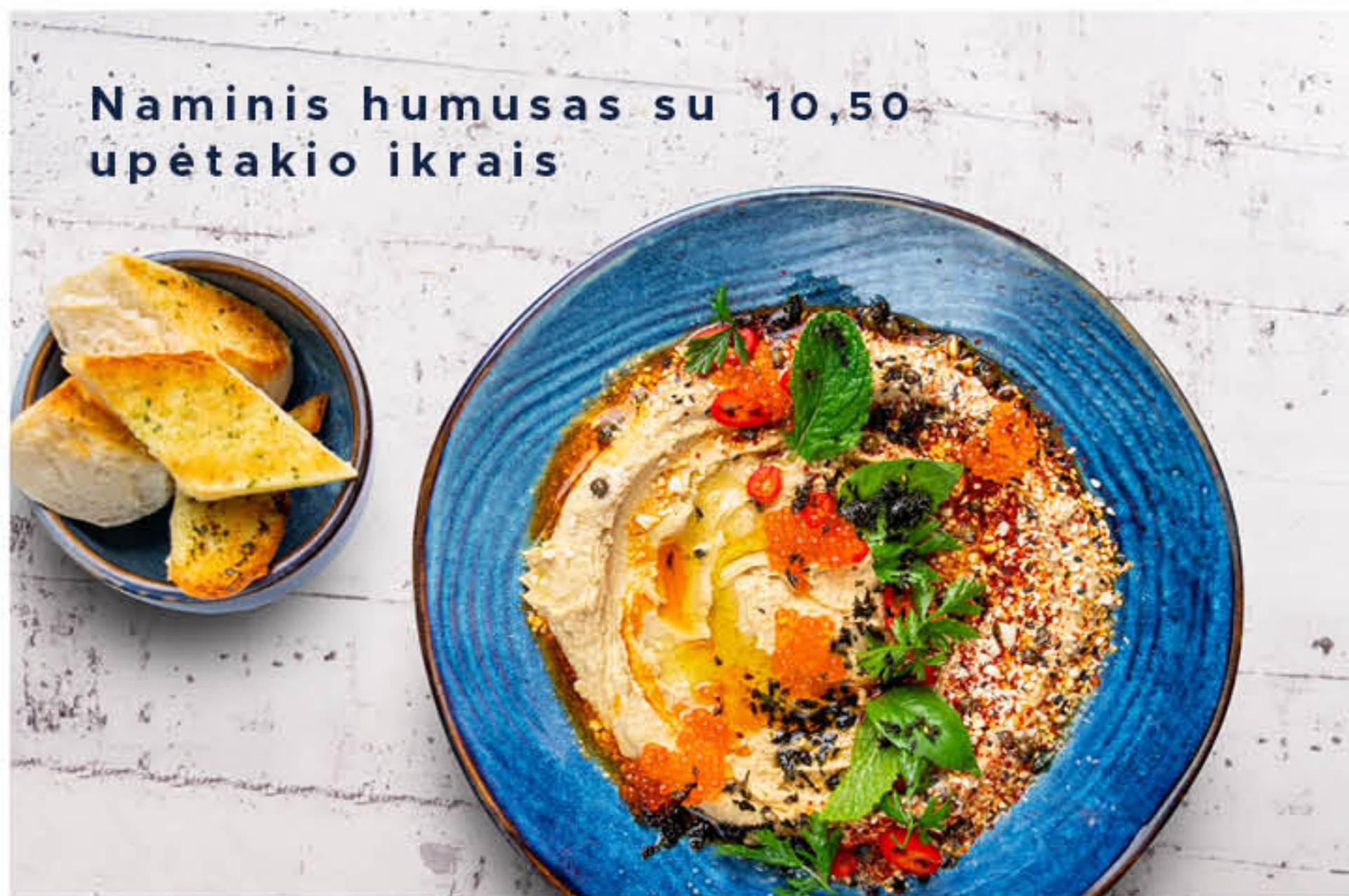
Naminis humusas su upėtakio ikrais 10,50