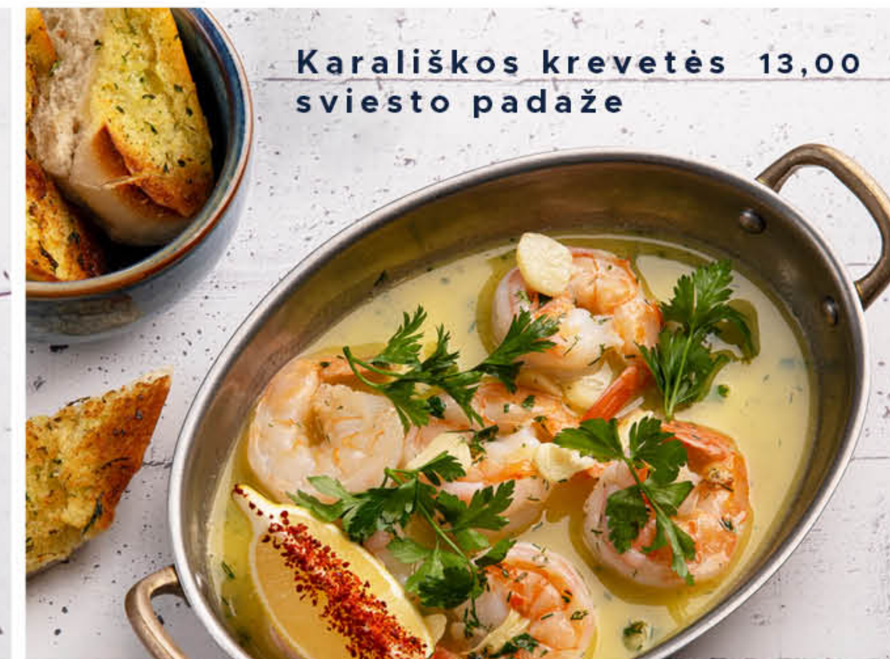
Karališkos krevetės 13,00 sviesto padaže