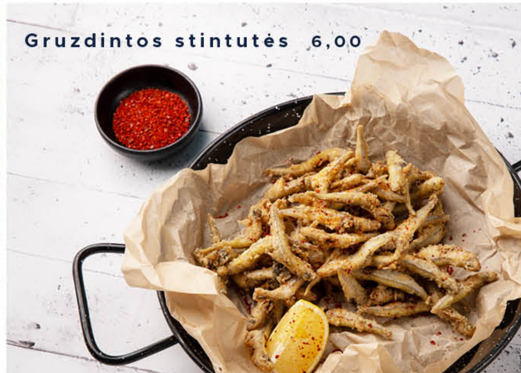
Gruzdintos stintutės 6,00