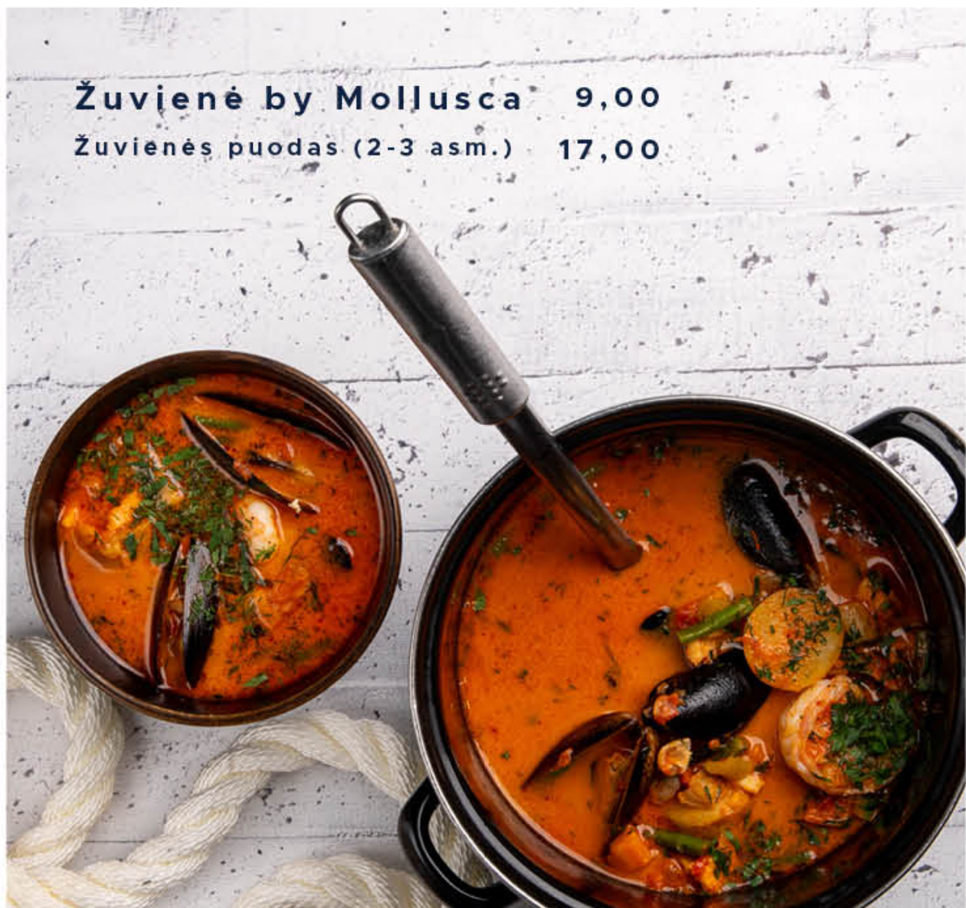
Žuvienė by Mollusca 9,00 Žuvienės puodas (2-3 asm.) 17,00