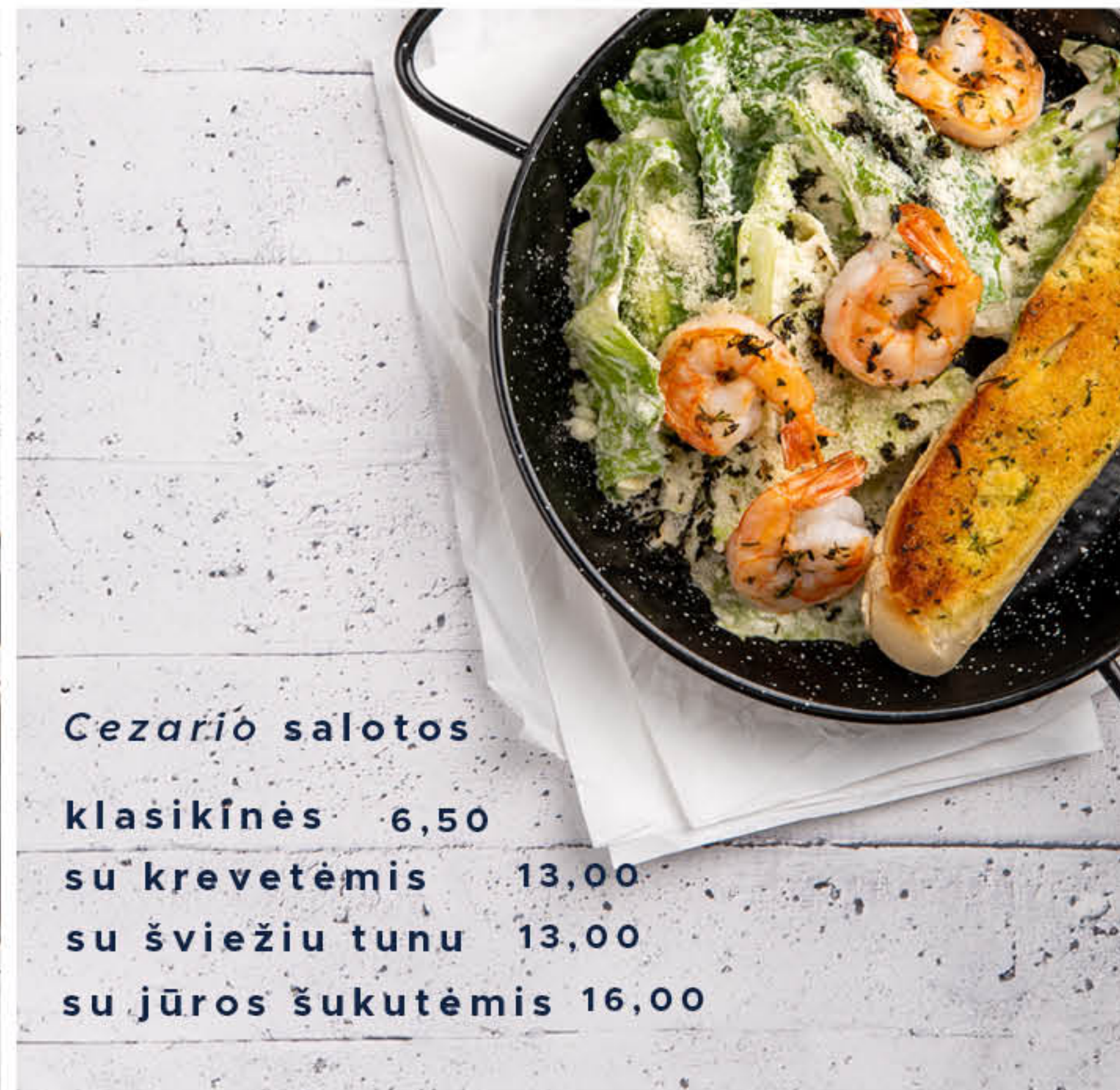
Cezario salotos klasikinės 6,50 su krevetėmis 13,00 su šviežiu tunu 13,00 su jūros šukutėmis 16,00